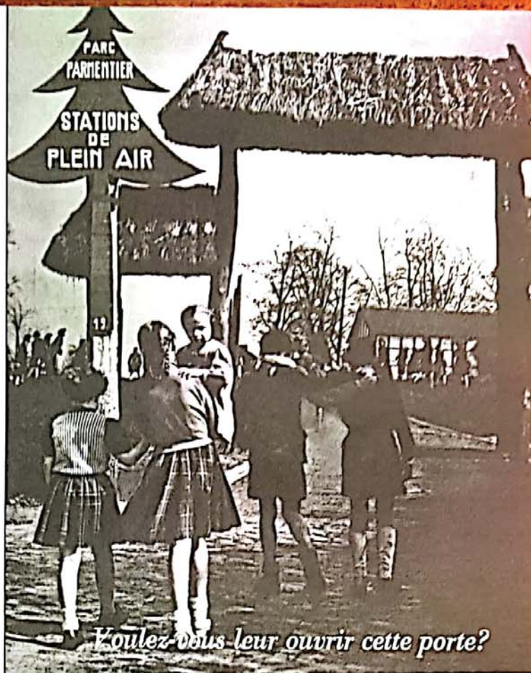
Vous êtes dans leur ouvrir cette porte?

Wat heeft u persoonlijk aan die kampen gehad?