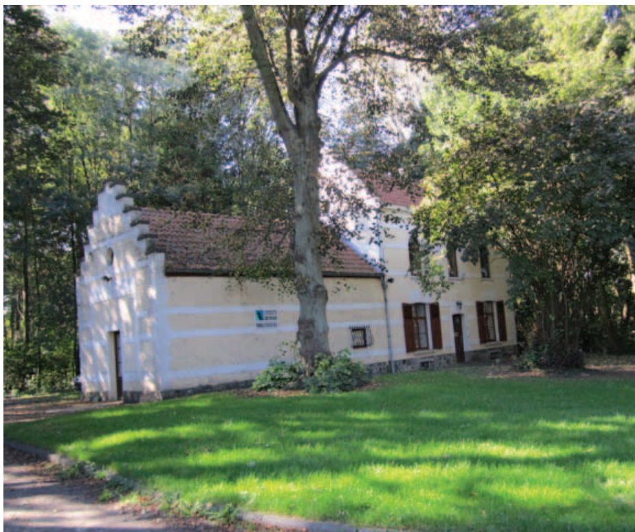
Onze kantoren in het Parmentierpark.

— De krant van de federatie Abbé Froidure —