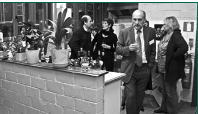
Bij deze gelegenheid werd het glas van de vriendschap aangeboden.